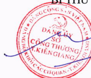
Ngô Công Tước