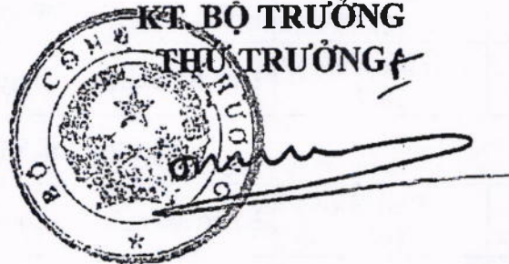
Đỗ Thắng Hải